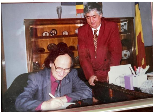
Grigore Vieru-Lazăr Cârjan- 1994

- Generale, mi-a spus Adrian Păunescu, Grigore are nevoie de odihnă și de liniște. A aflat că ai omenit 40 de copii basarabeni la Băile Felix și l-am convins că se poate trata și el în Bihor. Ce zici, ai putea să-i asiguri un sejur în stațiune? Te previn că a suferit mai multe crize de tensiune arterială oscilantă și trebuie să-l ascundem de politicieni și de ziariști. Te încumeți?